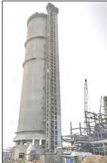
HURL-SINDRI -Prilling Tower