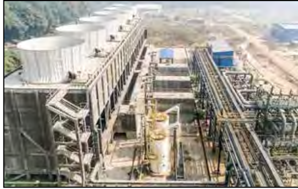
HURL-Gorakhpur- Urea Cooling Tower