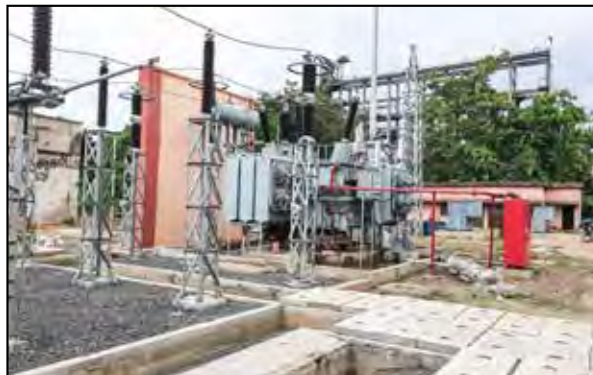
TFL -Electrical Substation for Const. Power