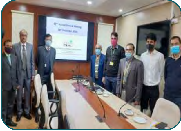
A view of 42nd AGM of PDIL