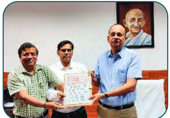
Signing of MOU for CSR Activity by PDIL, Noida