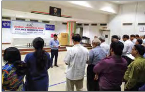
Vigilance Awareness Week Celebration at PDIL, Noida