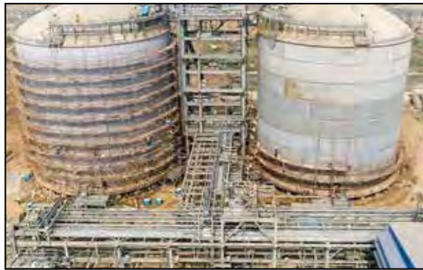
HURL-Barauni- Ammonia Storage Tank

IOCL also awarded orders for conducting Electrical Safety Audit of their LPG Bottling Plants at Jhunjhunu, Bikaner, Allahabad; Oil Terminals at Jaipur, Jodhpur, Mathura, Allahabad; Office Buildings at Gwalior, Chandigarh, Jaipur, Bandra, and Noida.