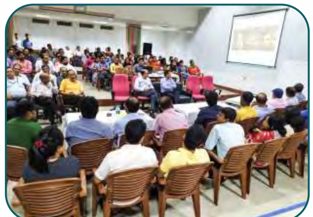
Hindi Pakhwada Celebration at PDIL Noida