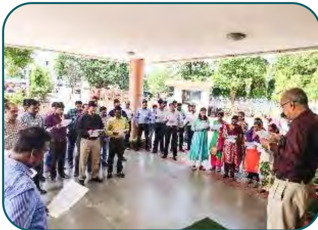
Rashtriya Ekta Celebration at PDIL, Vadodara