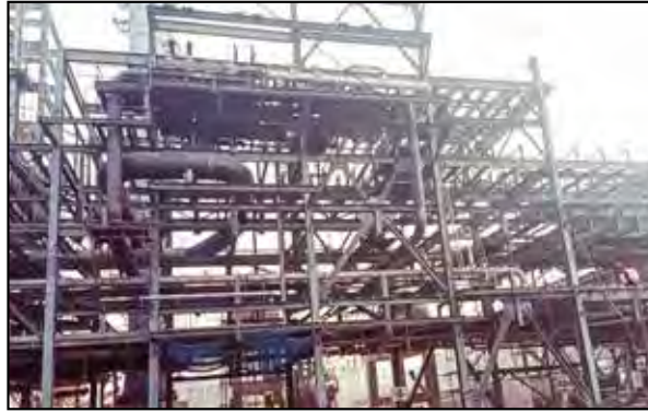
HURL-Barauni-Urea Piping Erection

पीडीआईएल ने मैथेनॉल, हाइड्रोजन, मीथाइल एमीन्स, सल्फ्यूरिक एसिड, फॉस्फोरिक एसिड, नाइट्रिक एसिड, सोडियम नाइट्रेट/नाइट्राइट, अमोनियम नाइट्रेट और अमोनियम बाइकार्बोनेट जैसे रसायनों क्षेत्र में कई परियोजनाएं आरंभ की हैं। पीडीआईएल ने गेल को पाटा में जीएसयू व जीपीयू में सुधार के लिए परामर्शदात्री सेवाएं, जीएसएफसी, बडौदा को मैथेनॉल संयंत्र के लिए विस्तृत इंजीनियरी सेवाएं, श्रीराम ईपीसी के लिए राउरकेला स्थित सल्फेट स्टील संयंत्र के अमोनियम सल्फेट संयंत्र व अमोनिया लीकर उपचारण संयंत्र के लिए मूल डिजाइन इंजीनियरी सेवाएं प्रदान की हैं। हाल ही में, पीडीआईएल द्वारा नेशनल फर्टिलाइजर लिमिटेड (एनएफएल) को पानीपत में सल्फर बेनटोनाइट संयंत्र स्थापित करने के लिए परियोजना प्रबंधन सेवाएं प्रदान की गई हैं।