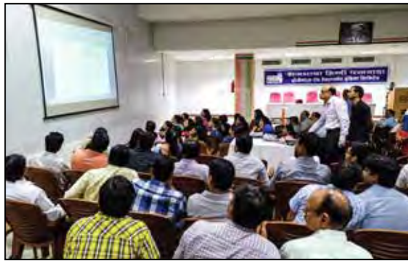
Rajbhasha Hindi Pakhwada at PDIL, Noida

में हिंदी के प्रयोग को बढ़ावा देने के लिए हिंदी टंकण को सुकर बनाने के लिए डेस्कटॉपों एवं लैपटॉपों में हिंदी सॉफ्टवेयर डाले गए हैं। कर्मचारियों को हिंदी में काम करने के लिए प्रोत्साहित करने हेतु हिंदी पखवाड़ा 2019 के दौरान प्रत्येक कर्मचारी को इंटरनेट व डेस्कटॉप पर 300 से अधिक हिंदी व अंग्रेजी के टिप्पणों का संकलन उपलब्ध कराया गया। प्रतिदिन हिंदी सुविचार और प्रतिदिन के सरकारी कामकाज में प्रयोग होने वाले अंग्रेजी शब्द का अनुवाद करके इसे सभी कर्मचारियों को ईमेल द्वारा भेजा जा रहा है। 14 सितंबर, 2019 से 30 सितंबर, 2019 तक 'हिंदी पखवाड़ा' आयोजित किया गया। निबंध लेखन, वाद विवाद, कहानी लेखन, हिंदी प्रश्नोत्तरी, अंताक्षरी, कार्यशालाएं जैसे विभिन्न कार्यक्रम आयोजित किए गए थे। इस वित्तीय वर्ष में आरसीएफ मुंबई एवं एनएफएल नोएडा द्वारा आयोजित राजभाषा सम्मेलन में पीडीआईएल के कर्मचारियों ने बड़ी संख्या में भाग लिया। उर्वरक विभाग, भारत सरकार द्वारा भी पीडीआईएल में बैठकों एवं निरीक्षणों के माध्यम से राजभाषा के कार्यान्वयन की प्रगति की समीक्षा व विश्लेषण करती है।