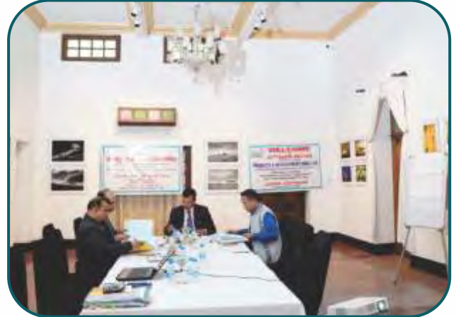
A view of Board meeting held at Lucknow