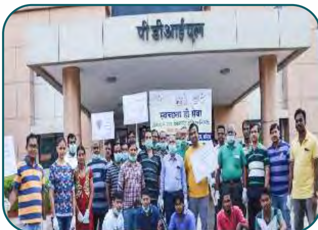
Swachhata Pakawada observed at PDIL, Vadodara.