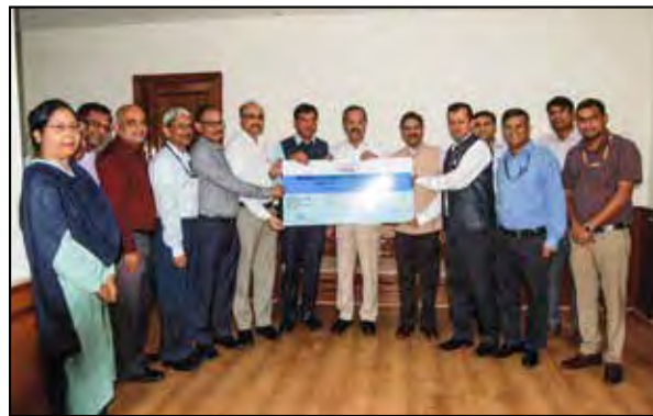
Dividend Payment by PDIL

पिछले वर्ष में 131.50 करोड़ रुपये की तुलना में इस वर्ष आपकी कंपनी का कुल टर्नओवर 142.16 करोड़ रुपये रहा जो कि 10.66 करोड़ रुपये की निवल बढ़ोत्तरी है। कंपनी को विगत वर्ष में 116.50 करोड़ रुपये की तुलना में प्रचालन से पहली बार 133.01 करोड़ का सबसे अधिक राजस्व प्राप्त हुआ। प्रचालन से राजस्व में पिछले वर्ष की तुलना में 14.18 प्रतिशत की बढ़ोतरी हुई है।