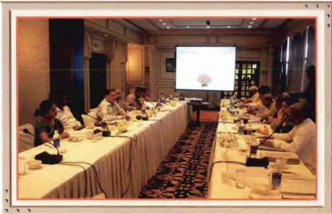
Review of Hindi Implementation of Noida office by Parliamentary sub Committee on Official Language

Your Company continued its intensive efforts to propagate and implement various provisions of Official Language Policy of the Government of India. For promoting the use of Hindi, in all the Departments, Hindi software has been loaded to facilitate Hindi typing. Every day a Hindi Suvichar and a translation of Hindi word are being e-mailed to all the employees on their computers. Many interesting programmes like Antakshari, Extempore speech Competition and Hindi quizzes are organized regularly. Hindi Pakhwara' was organized during 14 th September 2010 to 30 th September 2010. First sub committee of the Committee of Parliament on Official Language inspected Chennai office on 31.12.2010.