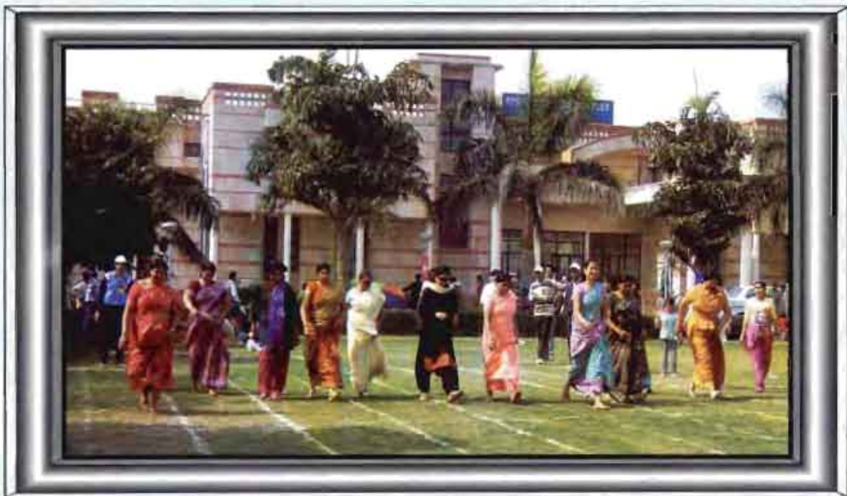
A view of Annual Sports day of PDIL celebrated on 13.2.2011 with active participation of family members of employees.

PDIL recognizes that the efforts of each and every member of the PDIL family is essential for development of the company. Recognizing the need for harmony among employees and their involvement, PDIL celebrated its Annual Sports Day on 13.2.2011. Employees along with their family members assembled together to celebrate the occasion. Sports & Cultural activities were organized. Right to information system is in place in the organization. Citizen Charter is in place in PDIL where general public can have information about the company and can redress the grievances.