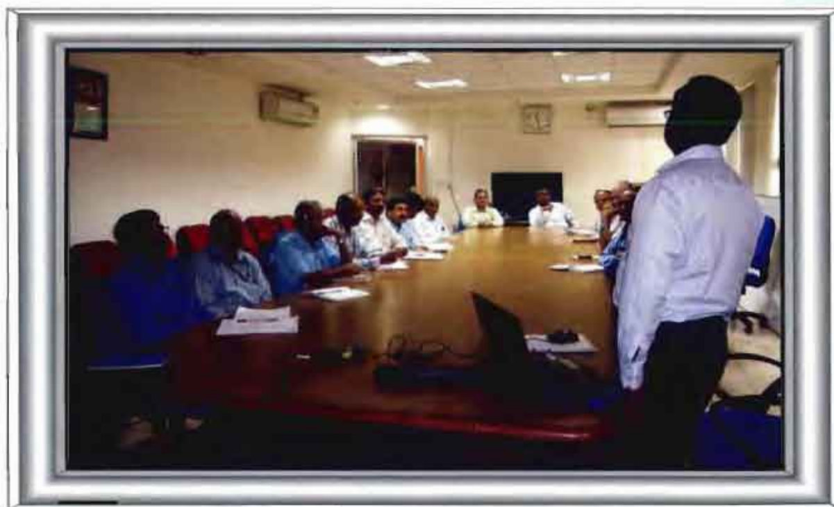
A view of Vigilance Awareness week with active participation of employees

'Vigilance Awareness Week' was observed from 25 th October to 5 th November, 2010, with active participation of the employees at various levels.