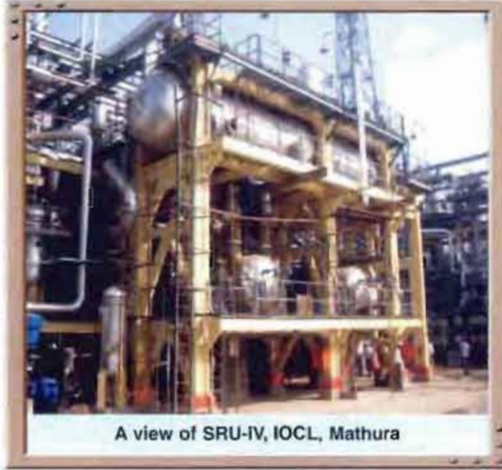
A view of SRU-IV, IOCL, Mathura

Your company has established its credentials for Third Party Inspection (TPI) and Non Destructive Testing (NDT) Services, Statutory inspection, testing and certification of Horton Spheres, Mounded LPG Bullets. Inspection and recommissioning of Ammonia Storage Tanks etc. continued to be a specialized activity of PDIL.